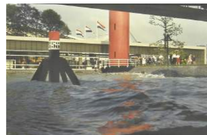
Dukdalf bij het Nederlands paviljoen

geopend zal worden en gedurende een jaar te zien zal zijn.