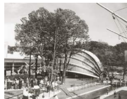
Koepel van het Nederlands paviljoen

deze Wereldtentoonstelling. De Nederlandse inzending bleek een groot succes. Het bezoekersaantal van 10 miljoen werd alleen overtroffen door de Sovjet Unie, Amerika en Frankrijk. De Wereldtentoonstelling werd in 1958 door 800.000 Nederlanders bezocht (toentertijd één op de 15 Nederlanders).