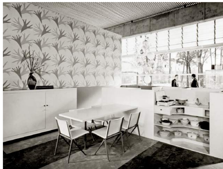
Mondial stoelen op de afdeling Moderne woninginrichting in het Nederlands paviljoen

Het project wordt georganiseerd naar aanleiding van het feit dat het in 2008 vijftig jaar geleden is dat de Expo '58 in Brussel plaatsvond. Eenenvijftig landen, waaronder Nederland, namen deel aan