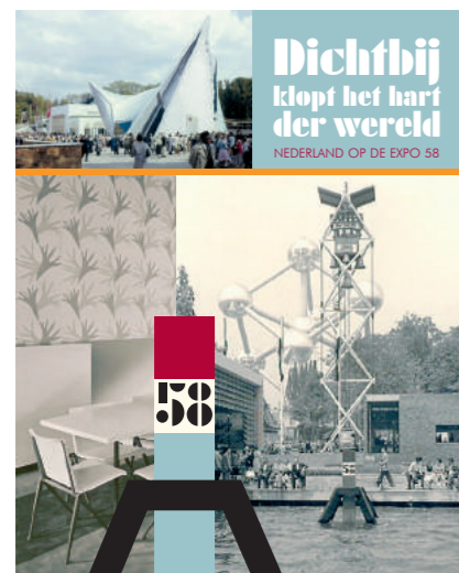
Voorkant van het boek "Dichtbij klopt het hart der wereld. Nederland op de Expo 58"

deze Wereldtentoonstelling. De Nederlandse inzending bleek een groot succes. Het bezoekersaantal van 10 miljoen werd alleen overtroffen door de Sovjet Unie, Amerika en Frankrijk. De Wereldtentoonstelling werd in 1958 door 800.000 Nederlanders bezocht (toentertijd één op de 15 Nederlanders).