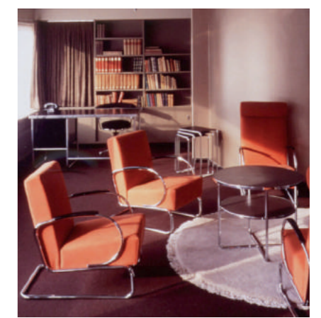
Huis Sonneveld, woonkamer

Naast het NAi, op de hoek van de Jongkindstraat en de Rochussenstraat, staat Huis Sonneveld. Het is een van de best bewaarde woonhuizen in de stijl van het Nieuwe Bouwen. Het is begin jaren dertig ontworpen door architectenbureau Brinkman en Van der Vlugt, bekend van de Van Nelle fabriek en het Feyenoordstadion en voor een groot deel ingericht met Gispen meubelen en lampen. Na een intensieve periode van restauratie en herinrichting, is Huis Sonneveld sinds maart 2001 als museumwoning van het NAi toegankelijk voor publiek. U kunt zelf ervaren hoe het is om anno 1933 in een hypermodern huis te wonen.