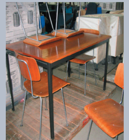
Onze nieuwe aanwinst in de opslag

Stoel no. 1263 is een ontwerp van André Cordemeyer. De stoel met verchromd frame werd geïntroduceerd bij Gispen in 1963 en dezelfde stoel met grijs gelakt en gemoffeld frame, no. 1262, werd vier jaar eerder in 1959 geïntroduceerd. Beide stoelen waren een groot succes en bleven t/m 1980 in productie. De stoel heeft zelfinstellende nylon vloerbeschermers, zogenaamde Delrin-doppen, die zich aanpassen aan de helling van de ondergrond.